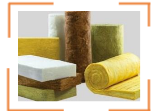
Mineral- & Glaswoole