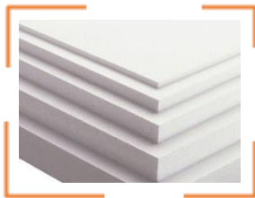
EPS, XPS, EPP Platten

Dies ist eine Einzeldrahtschneidemaschine zum Schneiden von: