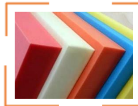
Expanded PP EPP