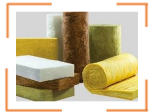
Mineral- & Glaswoole