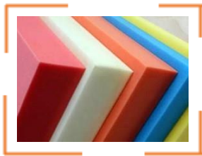
Polyurethane PU, PUR

Die Kaltdraht-Schneidemaschine FW 2000H arbeitet abrasiv : Genau genommen raspelt sich Ihr rauer Endlosdraht mit nahezu 300 km/h durch: