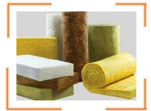
Mineral- & Glaswoole