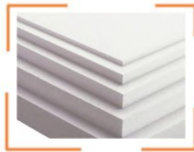
Polystrene EPS, XPS